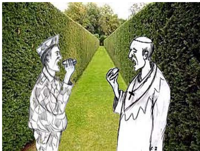
Disegno di Carlo Ziroldi

Accostandosi al naso il dito indice, Papa Paolo VI fece autorevolmente capire di