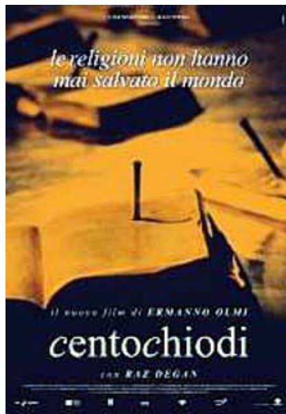
La locandina del film